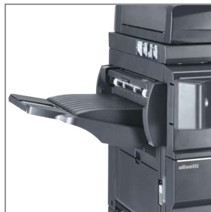
volitelné dokončovací zařízení dokumentů