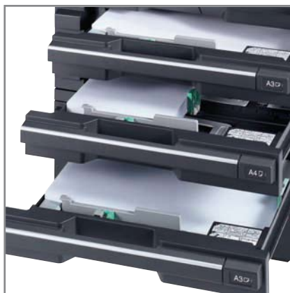
tři volitelné zásobníky papíru každý s kapacitou 300 listů