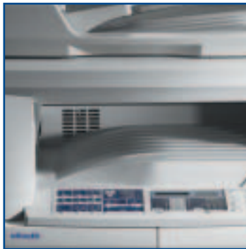
VÝSTUPNÍ KAPACITA až 250 listů tiskem dolů