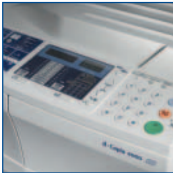
OVLÁDACÍ PANEL pro rychlý a snadný přístup ke všem digitálním funkcím