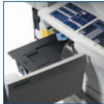
TONER až na 15 000 listů A4 (při 6% vykrytí)

Efektivita, spolehlivost a nízké provozní náklady jsou výraznými rysy těchto kopírek. Digitální kopírovací stroje Olivetti d-Copia 1600 a d-Copia 2000 využívají spotřební díly s prodlouženou životností , takže např. životnost válce je stanovena na 150 000 stran, toneru na 15 000 stran. Minimalizace provozních